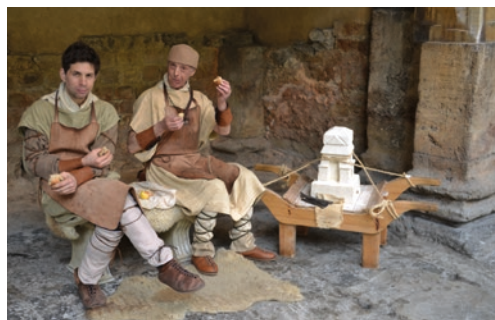
Eerste eeuwse klederdracht